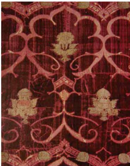
Fig.5. Velluto operato, metà XV sec., Riggisberg (CH), Abegg Stiftung Museum. Ordito di fondo e di pelo: cocciniglia polacca, dopo trattamento con tannini. Trama di fondo: legni rossi + reseda