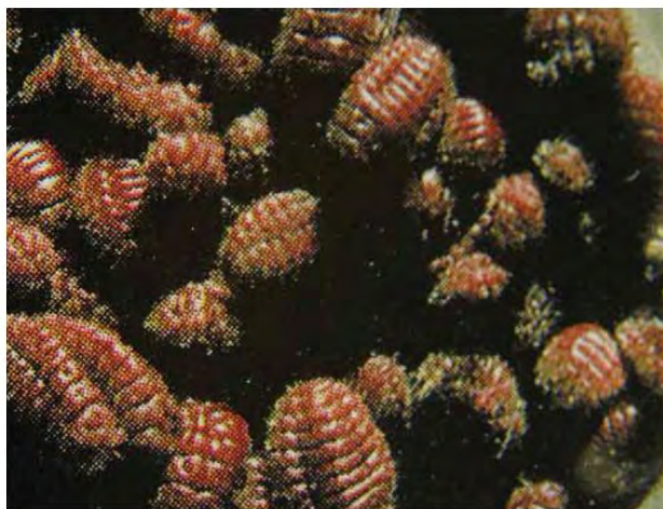
Fig.1: A fianco Kermes vermilio

Lo storico romano Flavio Vopisco, riferendosi a un episodio accaduto nel II secolo dopo Cristo, racconta che il governatore persiano inviò all'imperatore Marco Aurelio alcuni tessuti di lana che avevano un color rosso porpora assai più bello e brillante di qualsiasi altro tessuto mai visto prima di allora nell'Impero Romano. Paragonato a quei tessuti il vestiario di porpora indossato dall'imperatore e dalle matrone della corte appariva opaco e sbiadito. Allora tintori esperti furono inviati da Roma in India per cercare ciò che era ritenuto un colore ricavato dalla porpora e conoscerne i metodi di tintura. I tintori però tornarono senza aver trovato la materia ricercata e diedero soltanto vaghe notizie circa una 'porpora' che i Persiani ottenevano da alcuni tipi di pian-