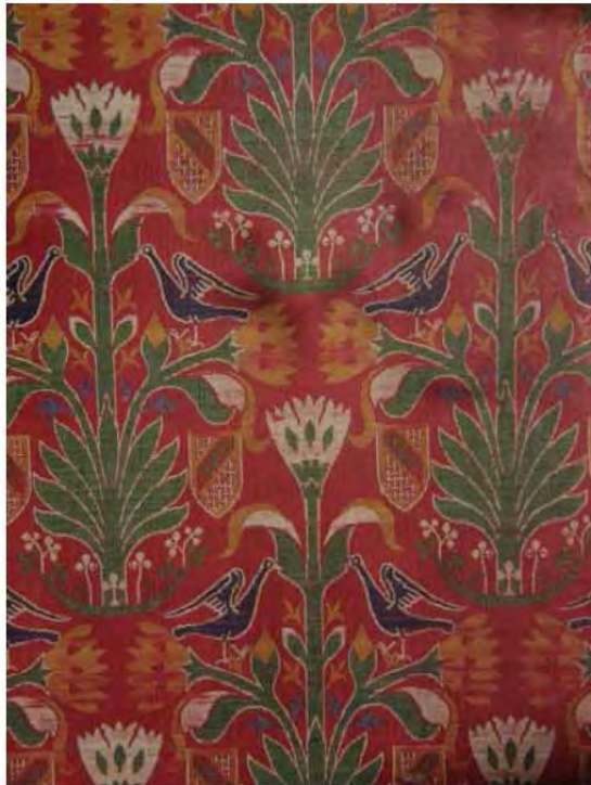
Fig.7. Lampasso spagnolo, metà XV sec., Riggisberg (CH), Abegg Stiftung Museum. Colorante principale: kermes

pullulavano a decine di milioni nel terreno o sugli alberi; un mondo quasi primordiale, ben difficile, oggi, da immaginare.