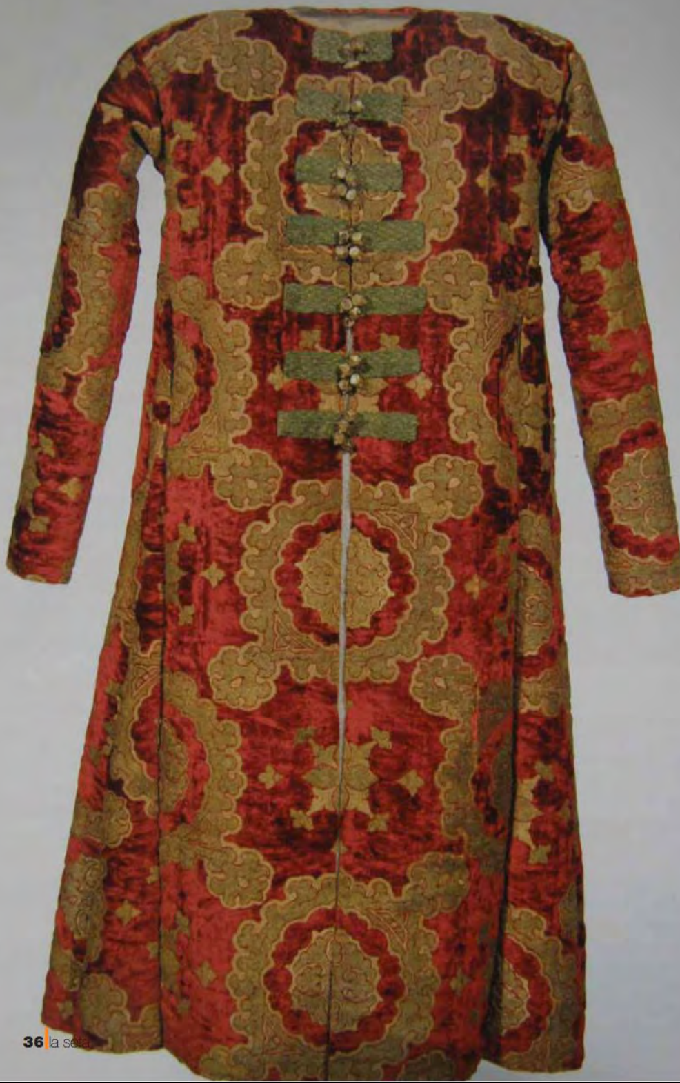
Fig.8: Caftano, velluto operato, fine XV sec., Bucarest, Museo Nazionale d'Arte. Ordito di pelo: kermes + cocciniglia polacca (o armena), dopo trattamento con tannini. Trama di fondo: legni rossi