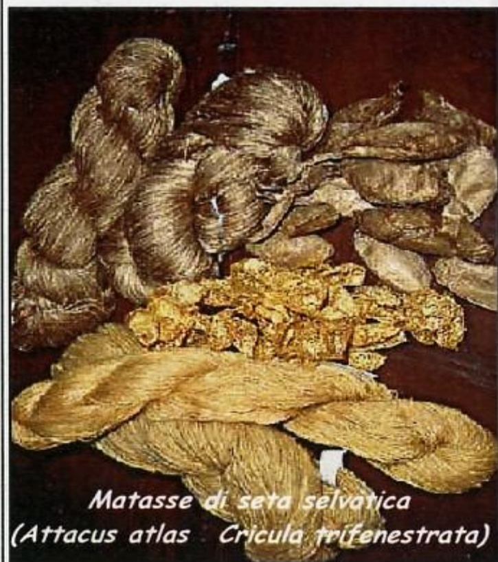
Matasse di seta selvatica (Attacus atlas - Cricula trifenestrata)

Altre sete selvatiche sono prodotte in vari stati africani ed asiatici per il mercato interno e forniscono impiego e sostegno economico ad un gran numero di comunità rurali.