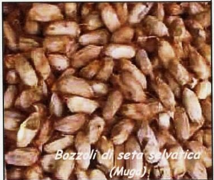
Bozzoli di seta selvatica (Muga)

Dai bozzoli della Saturnia pyri , e da quelli della Pachypasa otus , raccolti in natura sulle piante nutrici, si filava e tesseva l'antica seta del mediterraneo. Quando il segreto per allevare il baco da seta fu introdotto in occidente la produzione ed il commercio di tessuti di seta ottenuta da queste farfalle andò declinando, pur rimanendo a lungo, sino a pochi decenni fa, su alcune isole della Grecia. In Oriente invece l'apprezzamento e la richiesta per queste