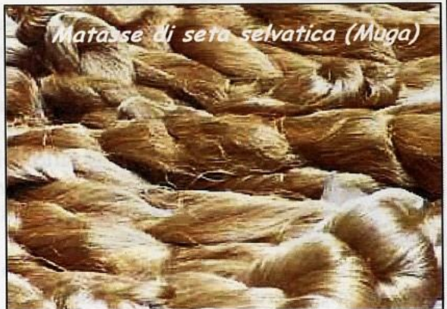
Matasse di seta selvatica (Muga)

conosciuta e richiesta dal mercato occidentale per la sua particolare consistenza e la sua lucentezza; è prodotta da alcune farfalle del genere Antheraea : Antheraea mylitta ed Antheraea roylei in India, Antheraea pernyi in Cina, Antheraea yamamai in Giappone; la qualità di quest'ultima è talmente alta che di recente il suo prezzo ha superato di trenta volte quello della seta domestica. L' Antheraea proylei , l'ibrido fertile